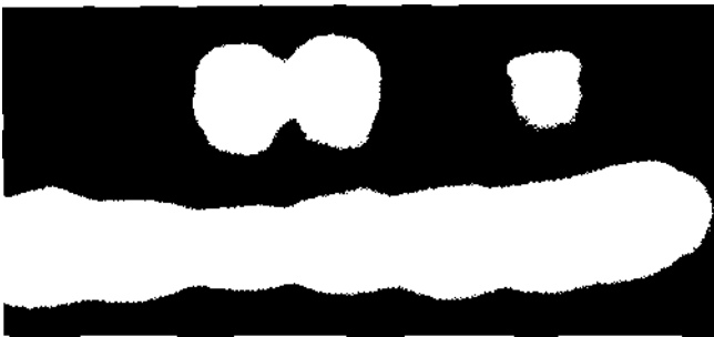
Abb. 3. Die ^{32}\text{P} -markierten Banden nach Amplifikation der Vorderkammerproben von Patienten mit CMV-Retinitis (Färbung eines Röntgenfilms)

1988 [4] beschriebenen Virusgenombereich mit den von ihm angegebenen Primern (Basen 1142 - 1166 und 1576 -1552) durchgeführt. Das Amplifikat wurde spezifisch mit einem synthetisch hergestellten und mit ^{32}\text{P} gelabelten Oligonukleotid ( 2 \times 10^5 cpm, aus dem Bereich 1312 - 1336 der Basensequenz) markiert [4].